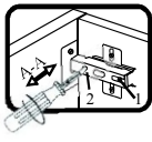
Схема установки опоры

Если створка наклонена вправо или влево относительно вертикали корпуса, нужно выправить наклон створки в направлении А-А винтом 2.